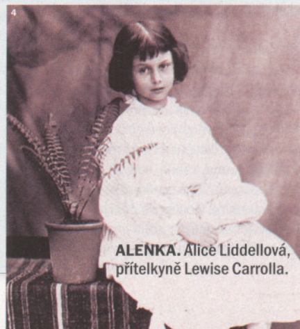
ALENKA. Alici Liddellová, přítelkyně Lewise Carrolla.