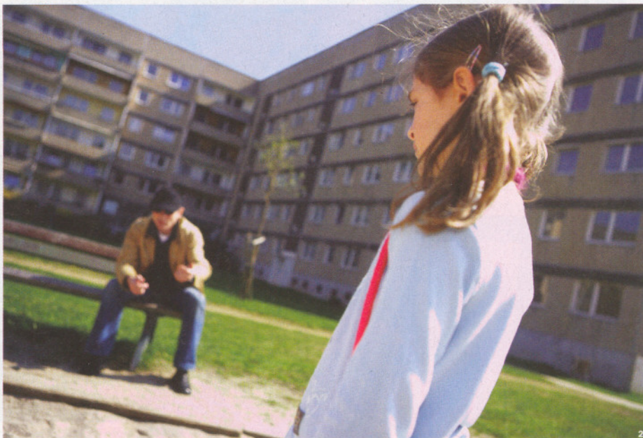
▲ ÚCHYLÁK. Pedofil většinou nebývá neznámý „úchyl“ na sídlišti nebo v parku, ale spíše oblíbený učitel, vychovatel, trenér. (Ilustrační foto.)